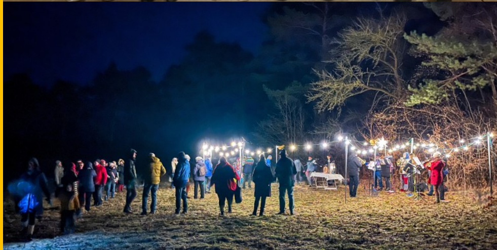
(Fotos: oben: Claudia Seegers: Seniorenadventfeier im Corvinushaus Mitte: Claudia Krabbes: KV-Einführung Witzenhäusen Unten: Pascal Dankenbrink: Waldweihnacht auf dem Burgberg