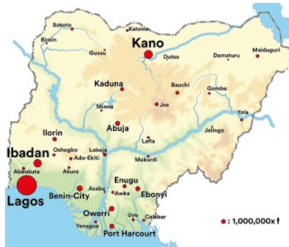
Eine Karte von Nigeria