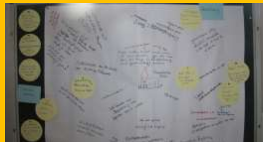
Studientage der Kirchenvorstände unseres Kirchspiels im Juli