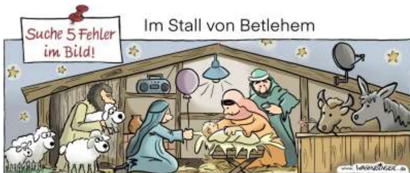
Radio, Luftballon, Lampe, Handy, Satellitenschüssel