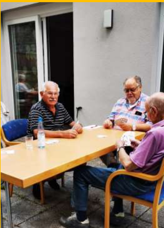
Eindrücke vom Gemeindecafé montags im Corvinushaus; Fotos: Ortmann