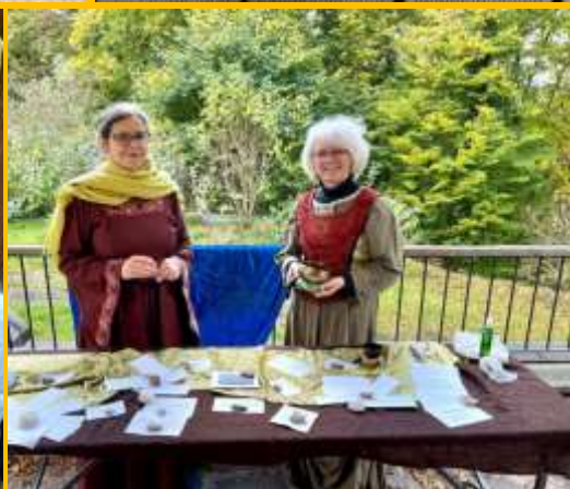
Oben: Maria, Eva & Co.—Auf den Spuren der H. v. Bingen; Fotos: Volker Lange, Unten: Sternenswanderung zum „Öhrchen“ mit Erntedank-GoDi; Fotos: Behringer